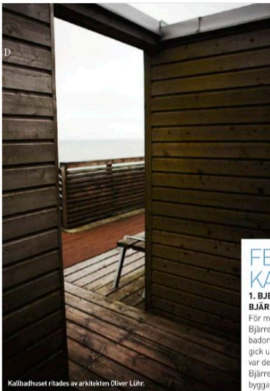
Kallbadhuset ritades av arkitekten Oliver Lühr.